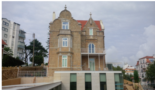
1. Vila das Acácias