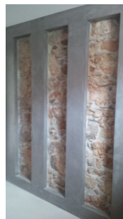
3. IS Comum